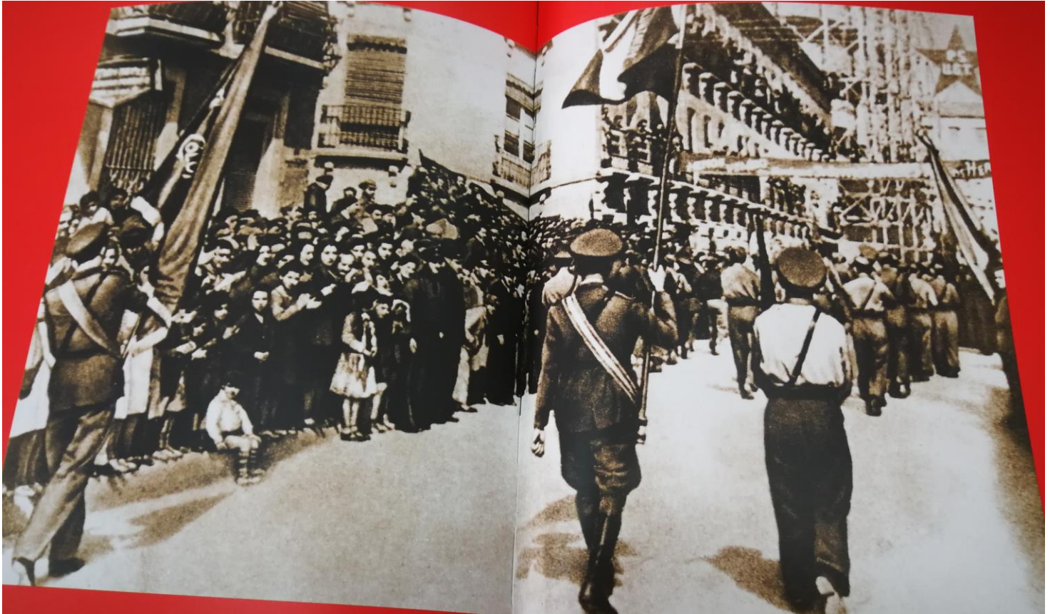
Edificio del Gran Hotel de Albacete, donde estaba una parte del Estado Mayor de las Brigadas Internacionales, así como un pequeño hospital. Grupo de brigadistas ante el Gran Hotel, en la Plaza del Altozano en Albacete.